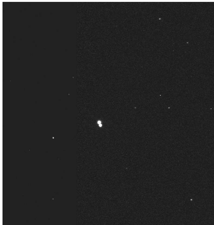
Abbildung 2: Die parallaktische Verschiebung von Irene zwischen Cerro Tololo und Teide beträgt etwa 6.8 Bogensekunden.